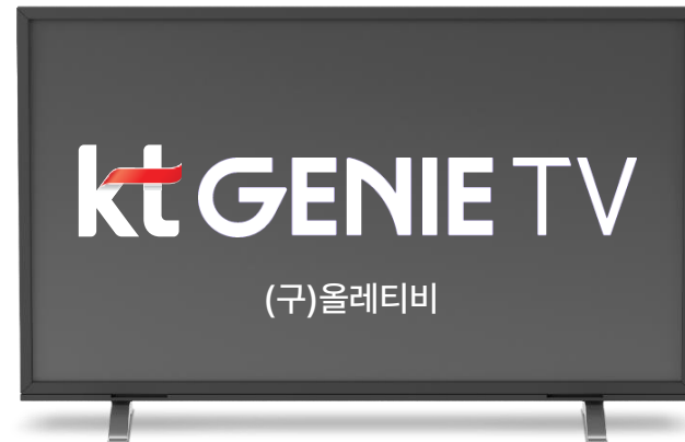
[채널 광고사이 120초 편성]

지역, 시청 이력, 채널 등 디테일한 송출 타겟팅 설정으로, 내가 원하는 곳! 우리 가게에 방문할 것 같은 동네 등을 선택해 효과적으로 광고할 수 있는 업체 맞춤형 광고입니다.